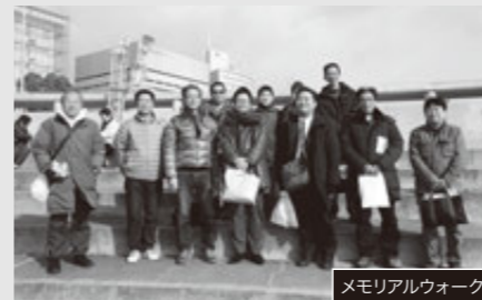
メモリアルウォーク