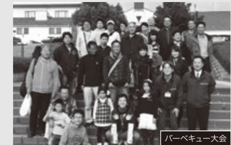
バーベキュー大会