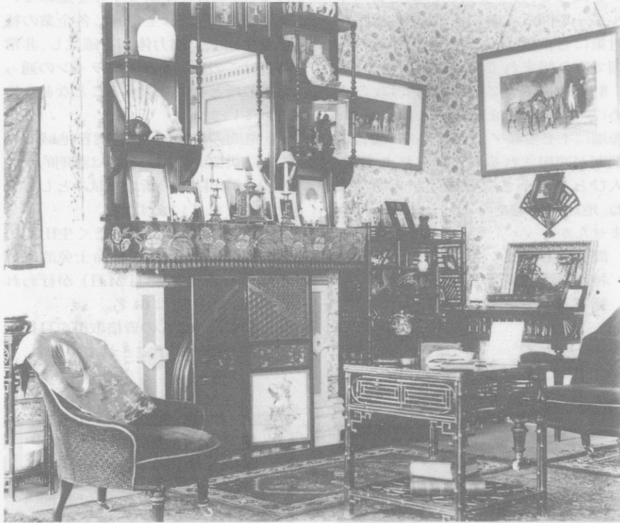
15番館内部のようす 1890年(明治23)「バーガレー氏個人アルバムⅡ」より

国指定重要文化財の15番館は、現存するただひとつの居留地時代からの建物でした。木骨煉瓦(レンガ)造・2階建て、2階南側の開放的なベランダが印象的でしたが、1995年(平成7)1月17