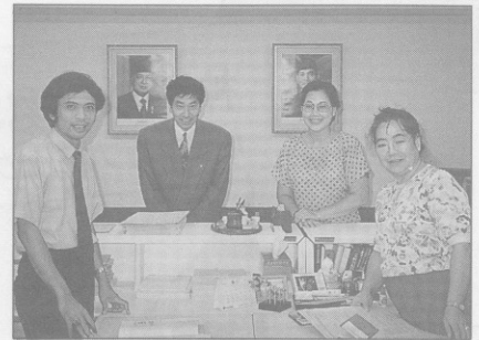
■インドネシア総領事館 〒650 神戸市中央区京町67 建大ビル2F・3F TEL(078)321-1656

総領事さんをはじめ、総領事館に勤めておられる皆さんも、みんな気さくで明るい方たちでした。