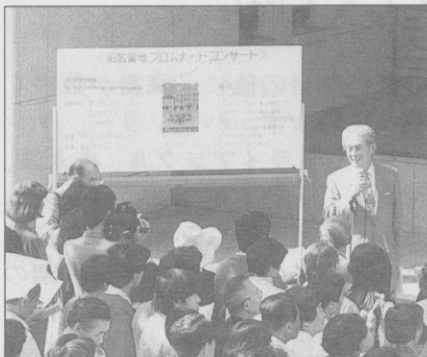
コンサート南会長挨拶

ンサートをとりあげていただきました報道関係のみなさまにも、厚く御礼申し上げます。