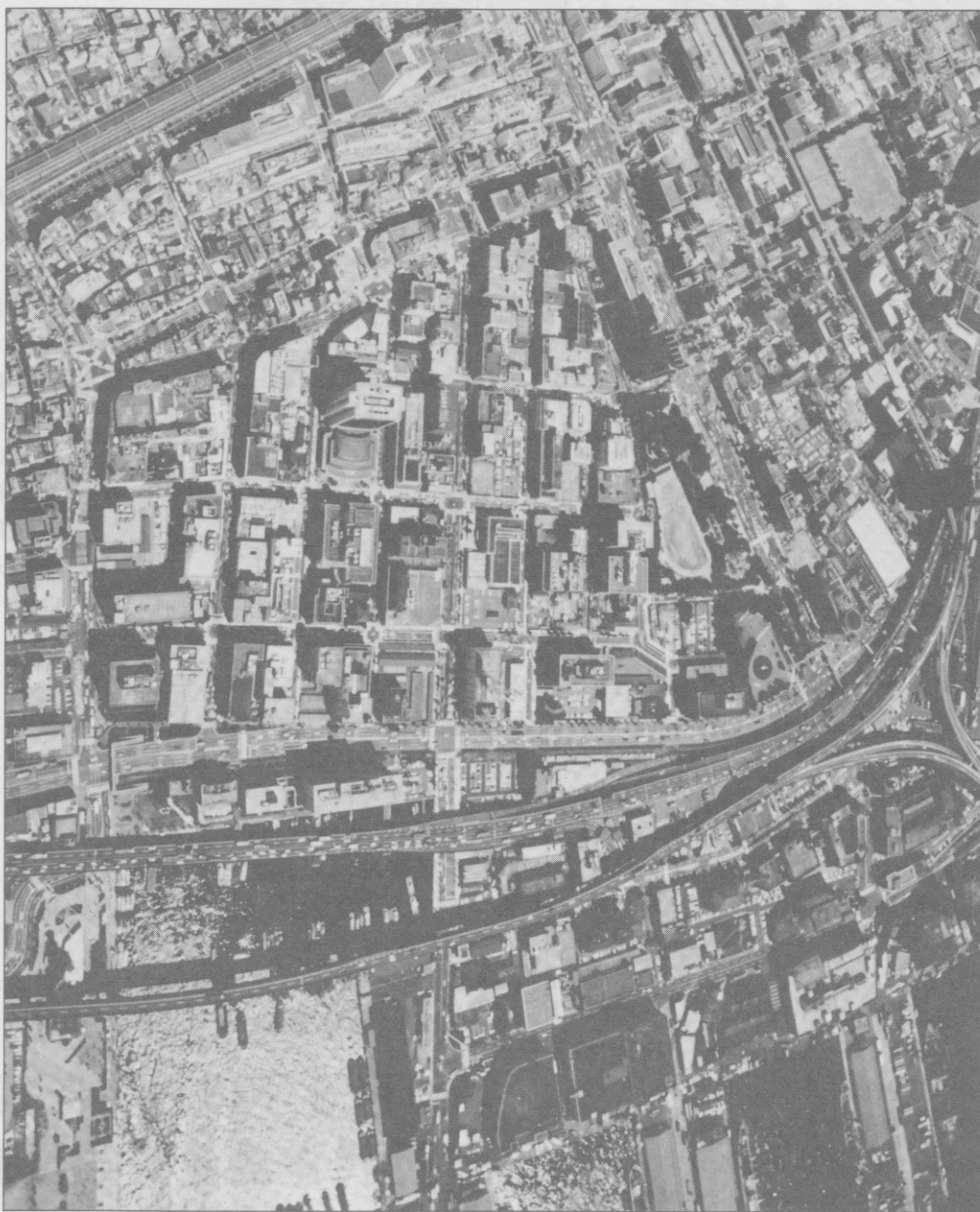
上空から見た旧居留地：1988年11月撮影

私たちは、こうした歴史ある居留地にいることに誇りをもちたいと思います。旧居留地の街並みは、いまもくっきりと、その姿を残しています。