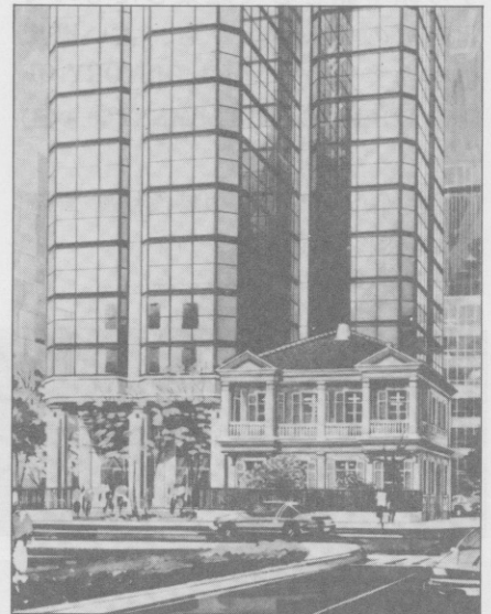
新館完成予想図(1990年6月)

1891年以降は、いろいろな企業がここを使っています。明治の末には、江商（現・兼松江商）神戸出張所、ついで同神戸支店、1967年にはノザワが買取り現在にいらっています。この商館が壊されずに残ることになったのは、榑ノザワのご尽力にほかなりません。私たちはその英断を讃えるとともに深く感謝申し上げます。